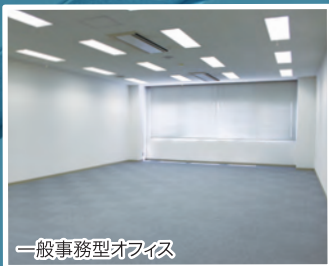
一般事務型オフィス

これから起業される方や、新事業の創業、最先端の研究開発に取り組む企業に対し、ニーズに対応したお部屋を提供します