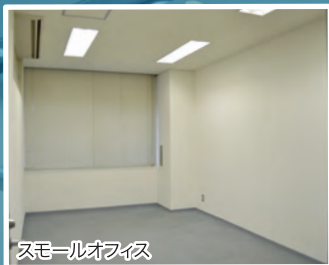
スモールオフィス