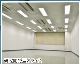
研究開発型オフィス